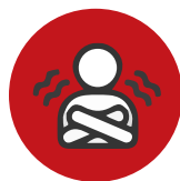
おかん 悪寒 (さむい)