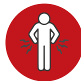
きんにくつう 筋肉痛