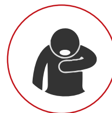
こきゅうこんなん いきぎ 呼吸困難・息切れ