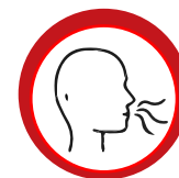
みかく きゅうかくしょうがい 味覚・嗅覚障害 あじ (味がしない・ においを感じない)