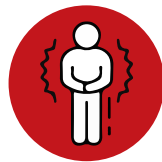
せんりつ 戦慄 (ふるえ)